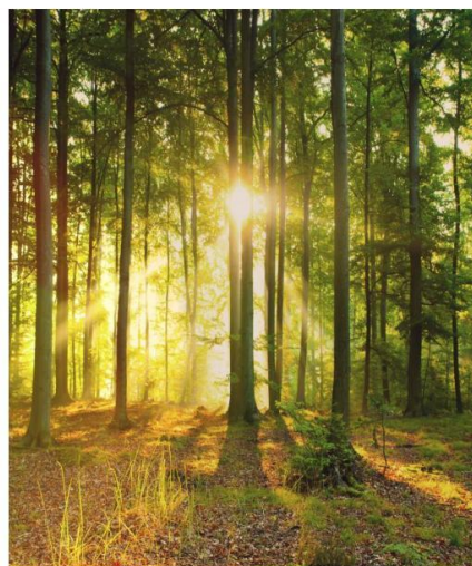
Rekenen in het bos